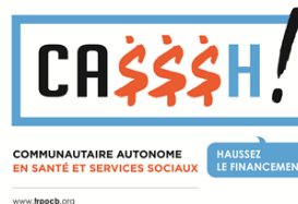
TABLE DES REGROUPEMENTS PROVINCIAUX D'ORGANISMES COMMUNAUTAIRES ET BÉNÉVOLES (TABLE)