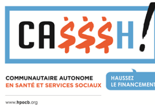
TABLE DES REGROUPEMENTS PROVINCIAUX D'ORGANISMES COMMUNAUTAIRES ET BÉNÉVOLES (TABLE)

1, rue Sherbrooke Est Montréal (Qc) H2X 3V8 514 844-1309 | (cell) 438-870-3271 info@trpocb.org | casssh@trpocb.org | www.trpocb.org/campagnecasssh | www.facebook.com/CAMPAGNECASSH